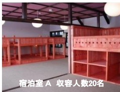
宿泊室 A 収容人数20名