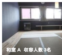
和室 A 収容人数3名